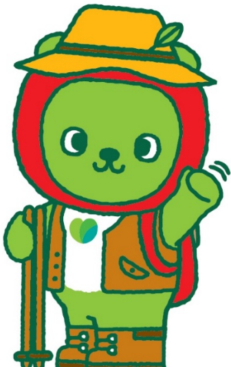
長野県PRキャラクター「アルクマ」 ©長野県アルクマ